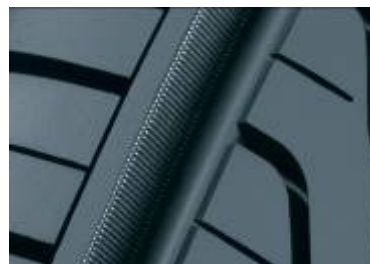
(サイレントウォール)

ショルダースリットを閉塞する事によりエアポンピング音を低減。 また、段差摩耗を抑制し摩耗後のパターン悪化も低減。