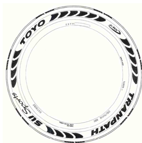
[ OUT側 ]