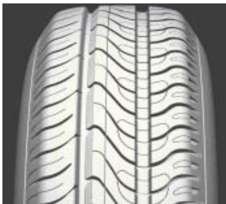
[ OUT側 ]