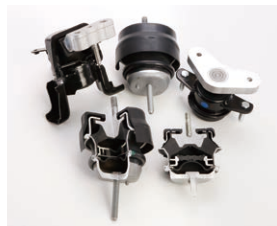
エンジンマウント (液封入タイプ)