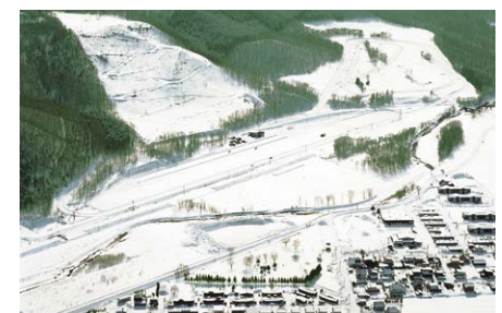
冬期タイヤテストコース(北海道)