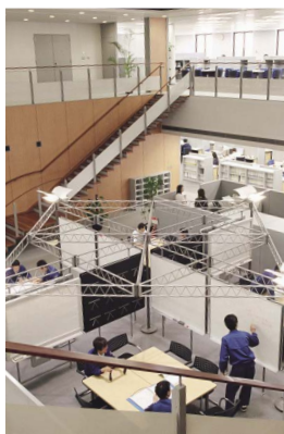
タイヤ技術センターミーティングスペース