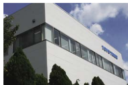
自動車部品技術センター(愛知県)