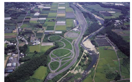
タイヤテストコース(宮崎県)