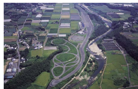
タイヤテストコース(宮崎県)