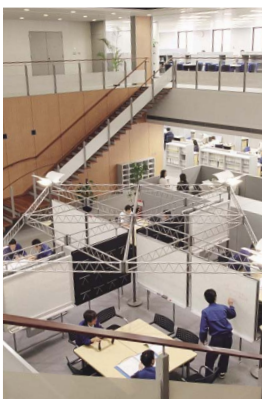
タイヤ技術センターミーティングスペース