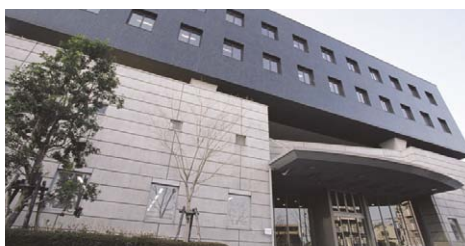
タイヤ技術センター (兵庫県)

自動車部品事業の鍵を握るのは、日進月歩で進む自動車産業の新技術に関する情報収集、自動車メーカーからの要求性能の実現のための技術確立、製品の高付加価値化です。これらを多面的に取り組み、あるべき自動車部品の実現に解析や評価技術力を研鑽しているのが「自動車部品技術センター」です。