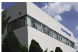
自動車部品技術センター(愛知県)