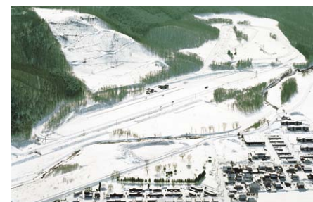
冬期タイヤテストコース(北海道)